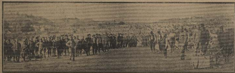
Los Estados norteamericanos han demostrado al mundo, lo que puede el terror patriótico. Por eso no es de extrañar el aspecto de entusiasmo que ha revelado el pueblo serbio en la movilización de su Ejército, cuyo reclutamiento empieza a efectuarse después del trémino.