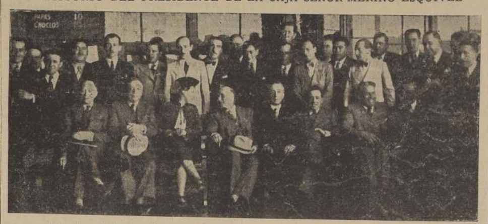
Asistentes a la inauguración de la sucursal de la Caja Agraria, en la Vega Central

Ayer a las 15 horas se llevó a efecto la inauguración de la sucursal de la Caja de Crédito Agrario en la Vega Central, destinada a prestar ayuda a pequeños agricultores que allí trabajan con sus productos, de acuerdo con la ley recientemente dictada.