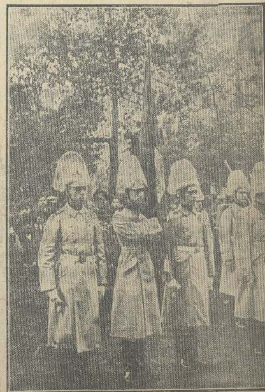
Frente a la Catedral: El antiguo y glorioso estandarte del regimiento Chacabuco, que fué sacado del Museo Militar, por un pelotón de la Escuela Militar.