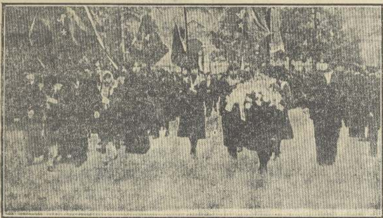
Las escuelas y colegios de niñas al iniciarse el desfile, conduciendo flores para depositarlas en el monumento en que están depositados los corazones de los héroes.

Banquete en el Círculo de Jefes y Oficiales Retirados.—Jura de la bandera en los cuerpos de la guarnición. Fiestas de los Boy Scouts.—Otros detalles