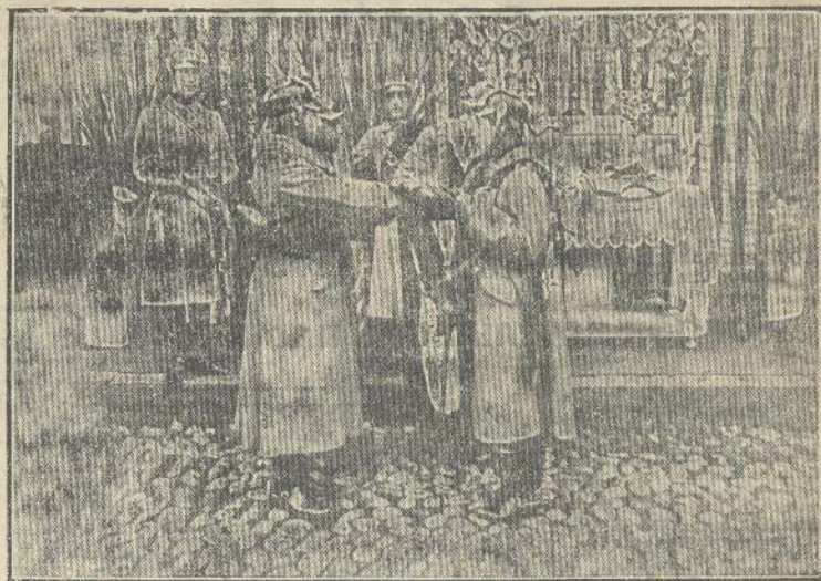
En el cuartel de Cazadores en el momento de prestar el juramento a la bandera, mientras el ayudante lee la promesa de estilo.

por frente al regimiento, mientras la banda ejecutaba el Himno Nacional, se procedió a guardarla con la ceremonia reglamentaria.