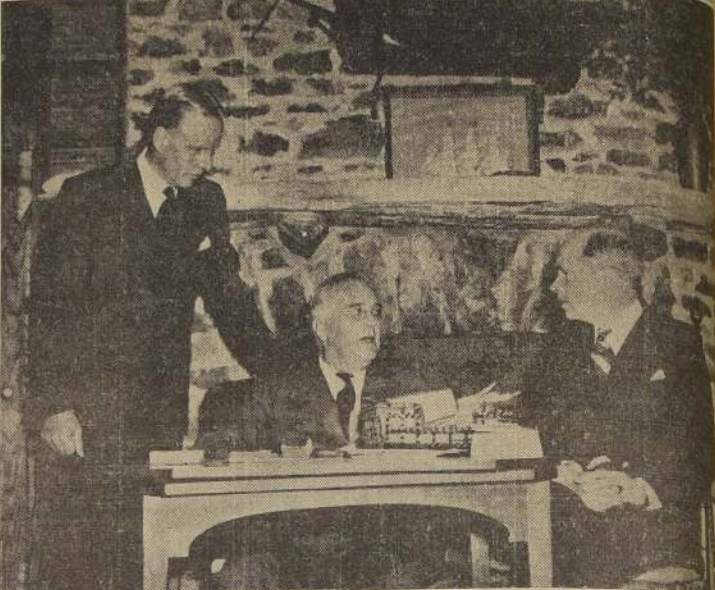
En su residencia de Warm Springs conferencia con el Presidente de los Estados, Mr. Roosevelt, los Embajadores de la Unión en Roma (a la izquierda) Mr. William Phillips, y el de Brasil (derecha) Mr. Hugh R. Wilson. Ambos diplomáticos informaron al primer magistrado norteamericano sobre la política interior en los países donde están acreditados.