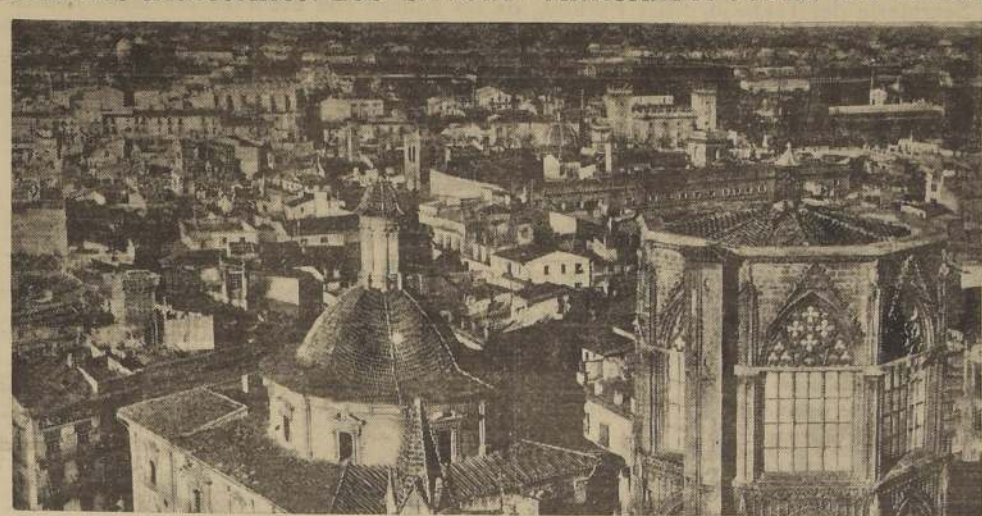
Panorámica de Valencia, atacada ayer por la aviación nacionalista. Los intentos de avance hacia los villorrios de Balaguer y Artesa, comunicados por el bando republicano. BARCELONA, 3. — (U. P.) El

Se sabe que el enemigo tiene una de las mayores concentraciones de fuerza aérea de toda la