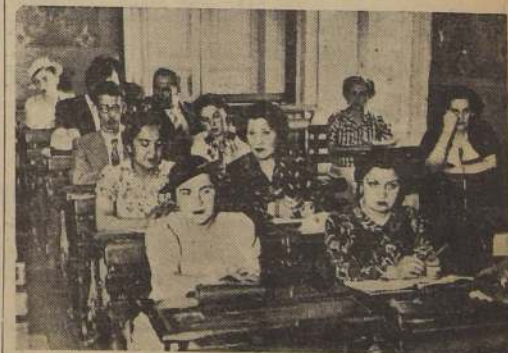
Durante una clase de los cursos de la Escuela de Verano

Más de 400 alumnos concurren a clases.— La matrícula continúa abierta para los profesores de provincias