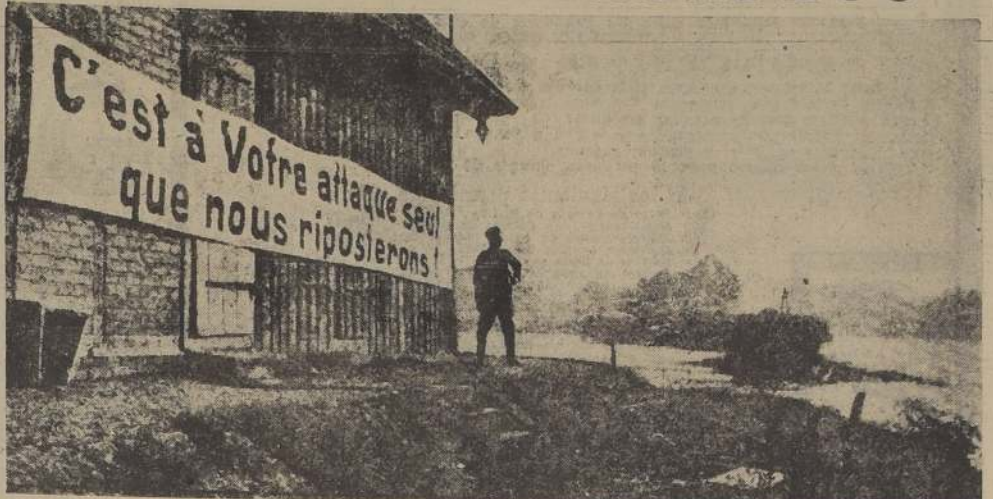
"Solo responderemos si nos atacan", dice este cartel colocado por los alemanes en la orilla derecha del Rin. Según informaciones cablegráficas llegadas ayer, no se ha cambiado un solo disparo en este frente de 240 kilómetros.