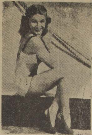
Arriba, Martha Ray y Paulette Goddard, de Paramount y Marion Martin, de Warner Brothers; al centro, Mary Martin, de Paramount, y abajo: Bárbara Reed y Sally Eilers, de R. K. O. Todas ellas, esplendorosas estrellas hollywoodenses que, huyendo de la sofocante temperatura veraniega de California, lucen al sol sus inquietantes formas entre una y otra zambullida en la piscina.