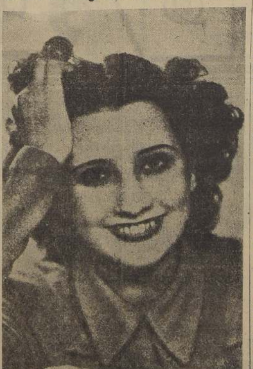
Hilda Sour, nuestra joven y atrayente actriz, a quien veremos actuar en "Divorcio en Montevideo", película distribuida por Silva y Maeda, que se estrenará próximamente, y que, según se asegura, será el éxito cómico del año. En este film se consagra como estrella la actual máxima atracción de la cinematografía argentina, Nini Marshall.