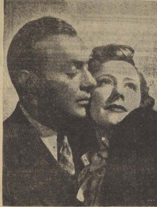
Charles Boyer e Irene Dunne, fulgurantes astros de la Universal, que son actualmente una de las más potentes figuras de la pantalla, en una apasionada escena de "Almas prisioneras", producción que se estrenará hoy, y cuyo argumento es una intensa historia de amor.