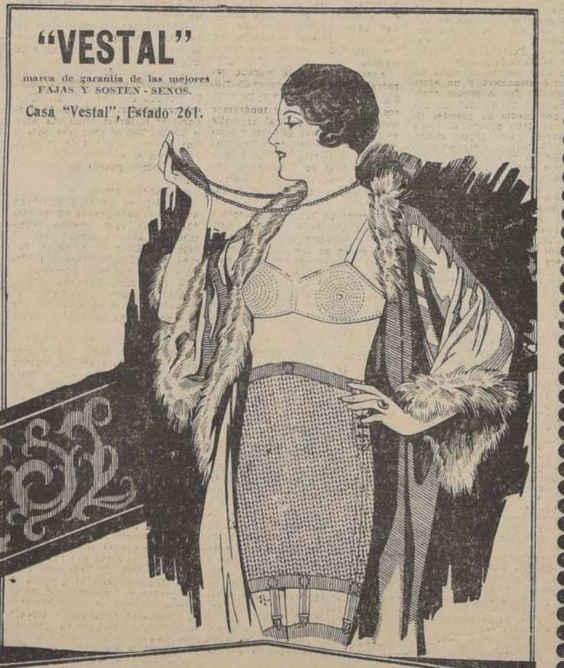
MODELO "VESTAL 34" De insuperable Tricot elástico, subida de estómago, con parte firme (no elástico) en el mismo tejido. Es una novedad. Le causará admiración por su excelente calidad y precio reducido.

Caja de Previsión de Empleados Particulares Se avisa a los imponentes en el Fondo de Retiro, que reanun las condiciones reglamentarias, y que deseen adquirir ellos mismos el edificio, que desde el miércoles 19 del presente estarán a disposición de los interesados los planos de los lotes de terrenos adquiridos ad-referendum por esta Caja. BANDERA N.º 231. — SEGUNDO PISO OFICINA N.º 213 EL JEFE. Cta-19 D.