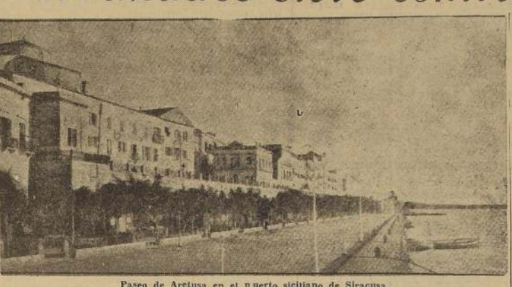
Paseo de Artusa en el puerto siciliano de Siracusa