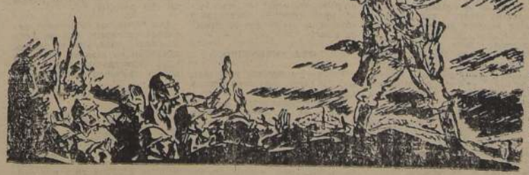
Haciendo creer que lo sigue una compañía gana su cruz de hierro