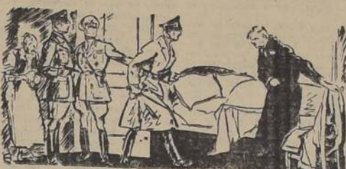
Personalmente "purga" a Rohem, el jefe depravado

Un emotivo que desconfiaba de todos. — La sobriedad de su vida. — Trabajador infatigable. — Cineasta consumado. — Novias y artistas. — La triste infancia del hijo de una criada. — Pésimo estudiante. — Artista frustrado. — Soldado mediocre. — Iniciación de la carrera. — La compra del abrigo de trinchera. — El fracaso de 1923. — Engaño de Ludendorff. — Epoca de miedo. — En prisión. — La toma del poder. — La purga de Rohem. — Respeto por Goering. — Desprecio por Goebbels. — Una completa biografía del Fuehrer