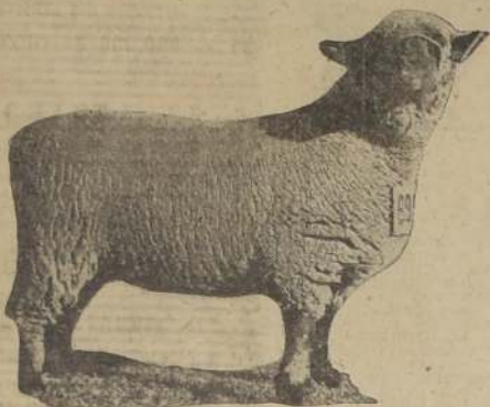
CARNERO "INVENCIBLE" 2.º PREMIO EN LA ROYAL SHAW