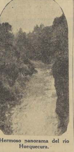
Hermoso panorama del río Huequecura.

no hasta Talcahuano. De ellos hay construidos 50 kilómetros, en los cuales se invirtieron este año $ 120,000 de fondos extraordinarios.