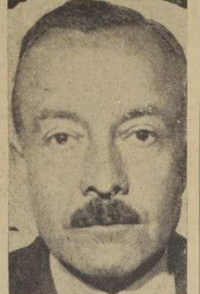
El Intendente de la provincia de Bio-Bio, señor Renato Valdés.

LAS OBRAS DE CAMINOS Le he dado especialmente importancia a cuanto se relaciona con la conservación y mejoramiento de la red caminera de la provincia. Para que se pueda juzgar de la labor ejecutada durante el presente año, voy a presentar los siguientes datos: Se han construido 70 kilómetros de camino de carácter definitivo.