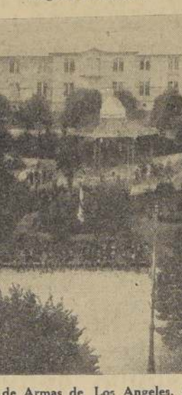
Aspecto panorámico de la Plaza de Armas de Los Angeles. Al fondo el edificio del Regimiento Pudeto.