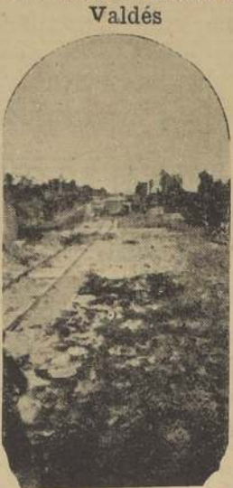
Terraplén en el camino de Los Angeles a Mulchén.

Tomando en consideración todo esto, mi primer pensamiento fue iniciar cuanto antes las obras necesarias para llevar a la realidad el proyecto a que me refiero; y así, a pesar de las dificultades propias de la estación de invierno, se ha habilitado ya, en inmejorables condi-