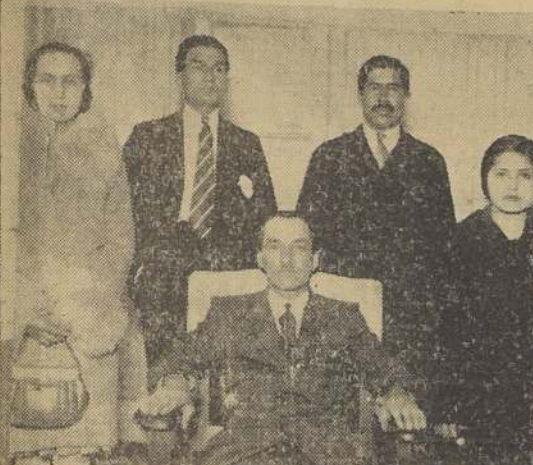
El directorio del Sindicato Industrial "Compañía Mac-Kay", recientemente formado entre el personal de esa fábrica y que cuenta ya con 274 asociados.