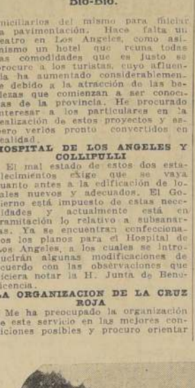
Un bello paisaje del Bio-Bio.