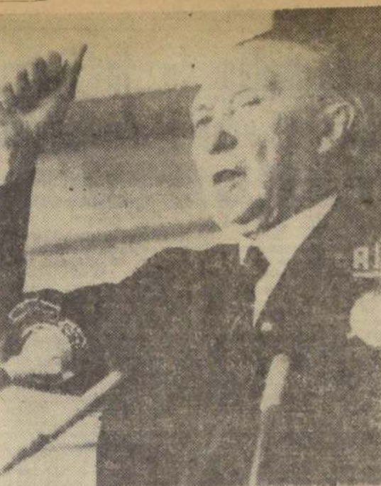
BERLÍN. — El Canciller de Alemania Occidental, Konrad Adenauer, levanta su mano durante un discurso que pronunció ante la Asamblea de la ciudad de Berlín Occidental, aquí el 11 de enero, inmediatamente después de su llegada para una visita de dos días a esta ciudad.

No nos apartaremos de este camino. Por eso pido confianza en Alemania —desde Berlín— para este llamamiento en favor de Alemania.