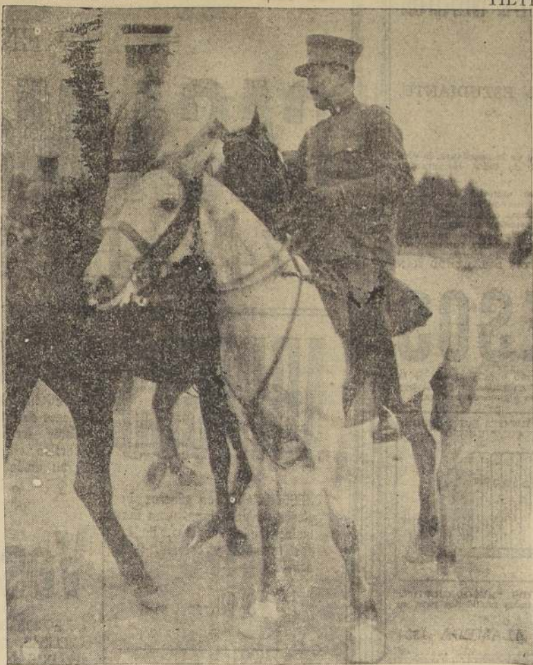
S. E. saluda al Adicto Militar del Brasil.

DE LAS DIVISIONES Y DE LA AVIACION EN ESTA OPORTUNIDAD.— LAS TROPAS DE LA II DIVISION FUERON REVISTADAS POR S. E. EN LIMACHE, Y LAS DE LA III DIVISION EN TILTI