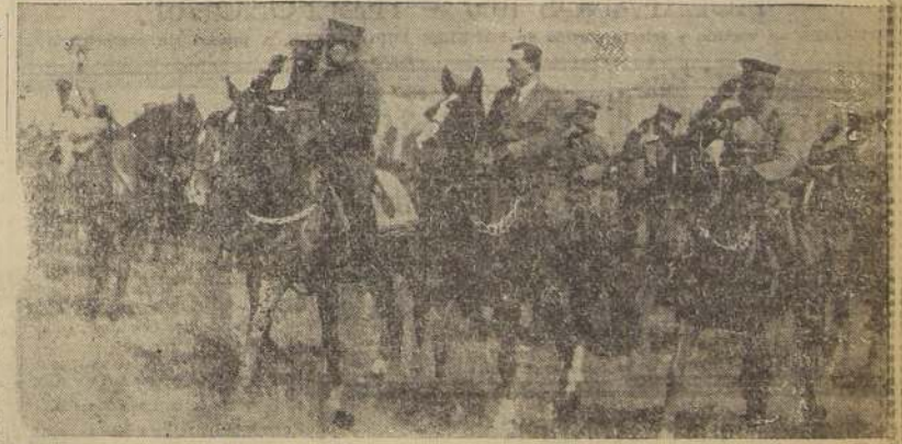
S. E., el Ministro de Marina y el Inspector General del Ejército, al llegar al Club Hípico de Lima

Esta tarde de ayer, la Dirección General de Impuestos Internos, en una nota al Ministerio de Hacienda, la cual se le solicita dirigirse a la Superintendencia de Salitre y Minas para que preste su cooperación en la tasación de las propiedades carboníferas. Las minas de carbón, que tienen características especiales, exigen para su avalúo un trabajo minucioso y acabado, dice en su nota el Director de Impuestos al Ministerio de Hacienda, y que por no contar en la actualidad con los medios técnicos apropiados para dar cumplimiento a las disposiciones de la ley sobre avalúo, solicita la cooperación de los Ingenieros de la Superintendencia para efectuar tal trabajo.