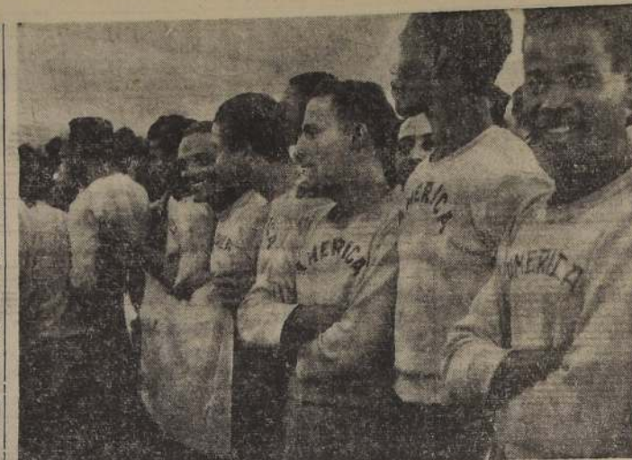
Lindo gesto fué el de los jugadores del CLUB AMERICA, DE RIO DE JANEIRO, que fueron a esperar a las basquetbolistas. Los jugadores brasileños se ganaron mercedemente una estruendosa ovación de parte de más de cinco mil personas que estaban en Los Cerrillos.

FESTIVAL PARA EL SABADO. — En las canchas del Estadio Pedro Aguirre Cerda, ubicado en Pedro Donoso 1501, se efectuará el día indicado un programa que incluye los siguientes partidos: — Los Hermanos con Pedro Aguirre Cerda, segundos equipos; 16 horas, Sergio Gálvez con Los Hermanos, cuadros superiores; 17-18 horas, Capri con Velasquez, primeros elencos; Juventud Santa María