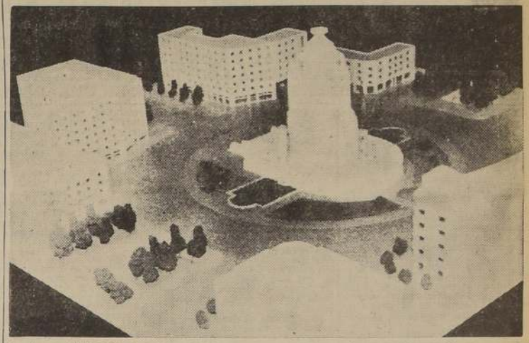
La "maquette" del Altar de la Patria, monumento que será construido al término de la actual Avenida Bulnes, frente a la Plaza de Almagro.

Dentro de poco tiempo, la ciudad de Santiago contará con uno de sus monumentos más grandiosos, modernos y de mayor significación nacional.