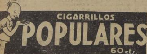
CIGARRILLOS POPULARES 60 ct.

(Dos años ha y un día cumplísteis tan zolemne profecía).