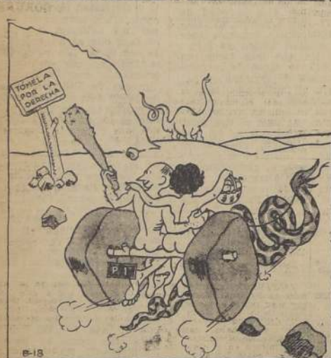
(De "El Romancero de Pipa")