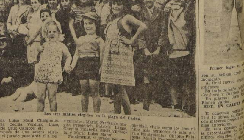
Los tres niños elegidos en la playa del Casino.

Vertical text on the far right edge of the page, partially cut off.