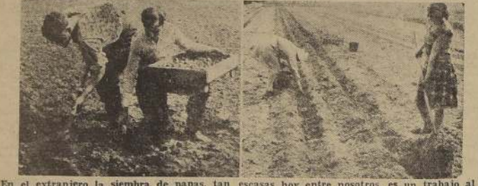
En el extranjero la siembra de papas, tan escasas hoy entre nosotros, es un trabajo al que se dedican los jóvenes y niñas que no han podido ir al "frente".