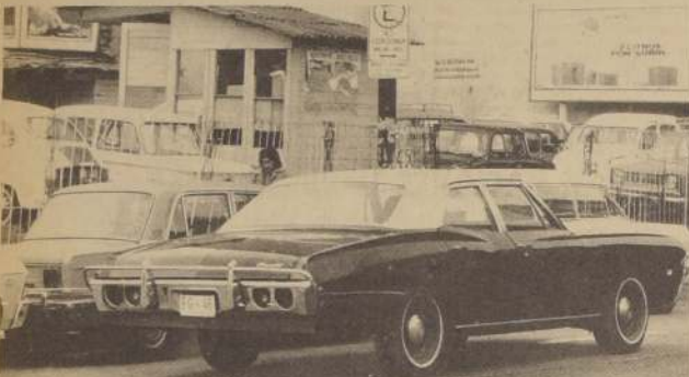
AQUELLOS TAXIS que no lleven en su interior un tarjetón, autorizado por la Subsecretaría de Transportes, indicando las tarifas, no podrán cobrar los nuevos precios publicados ayer por el Diario Oficial.

Finalmente, las tarifas especiales dentro del radio urbano, tales como contrataciones por hora, acompañamientos funebres, casamientos, etc. estarán sujetas a tarifas a convenir entre el chofer y el pasajero.