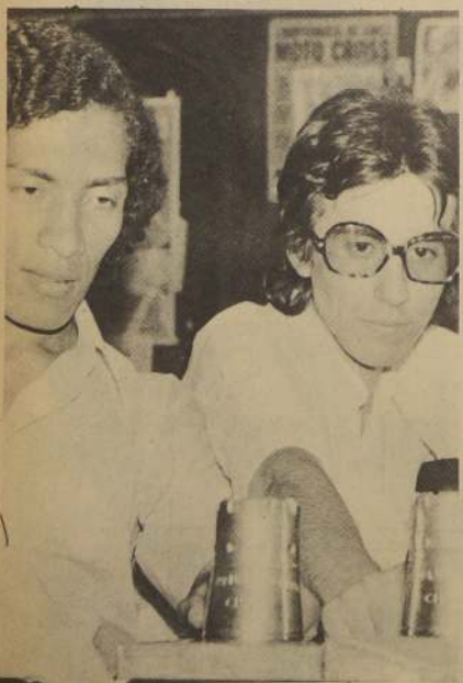
"LOS DOS" miran dos de los cuatro Torreones de Oro que ostentan por su participación en el último Festival de Valdivia. Trofeos justamente recibidos por estos sencillos artistas.

Y con la filosofía, del que aprendió a luchar, dijo esta noche hay estrellas, un amanecer me espera y silbando Juan se va".