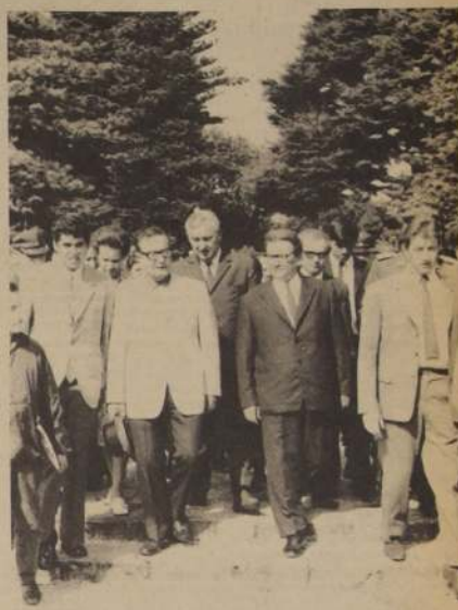
El Compañero Presidente visitó el centro carbonífero de Lota. Tras dialogar con los mineros, recorrió el Parque de dicho centro minero, aspecto que registra el grabado.

El programa que cumplirá hoy el Presidente Allende consulta la inauguración del muelle mecánico de la Compañía Industrial de Fosteros de Perco, a las 9.30. A continuación visitará la fábrica Faraloz, las industrias textiles de Tóme y, finalmente recorrerá la fábrica Caupehuan de Chiguayante.