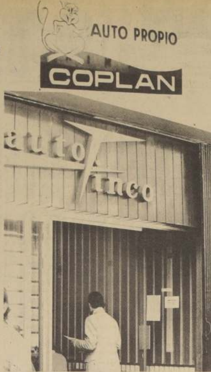
EN BUSCA DE UNA QUIMERA: Comprar un auto propio, en cuotas mensuales y al precio oficial, en alguna de estas "empresas financieras".

Con estos ejemplos, el sufrido comprador podrá darse cuenta del lugar a que van a parar sus ahorros y la escasa posibilidad que tiene, de adquirir un vehículo propio, con la quimera de estas empresas financieras.