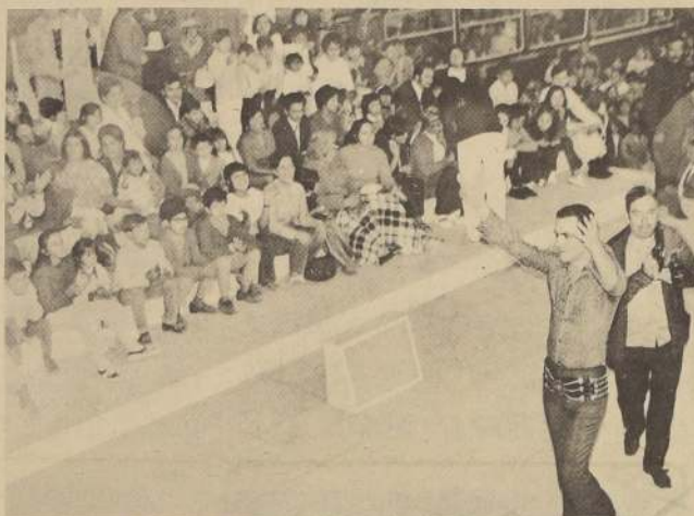
EL GRABADO corresponde a una actuación de Leonardo Favio en la Plaza del Pueblo (ex Parque Italia de Valparaíso), el año pasado, cuando viajó a CHILE POR UNOS DIAS. Pero lo que el debe recordar fue su sensacional debut en el Festival de la Canción, hace unos años.