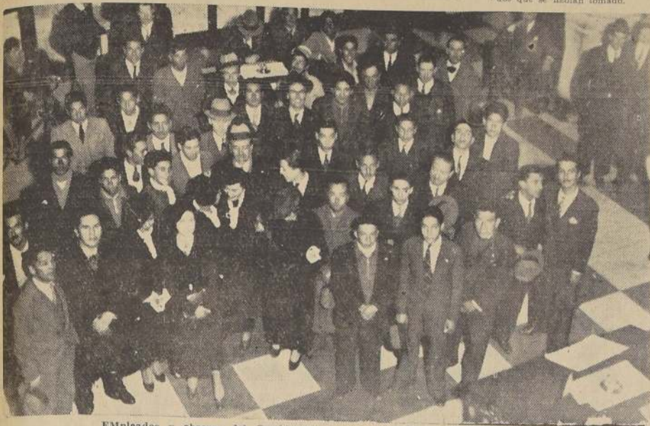
Empleados y obreros del Canódromo durante su visita a "LA NACION"

tiempo con respecto a las demás instituciones que realizan análogas actividades. Una vez levantada la sesión los miembros de los diferentes Comités visitaron nuestro diario donde nos dieron detalles de la reunión celebrada y de los acuerdos que se habían tomado.