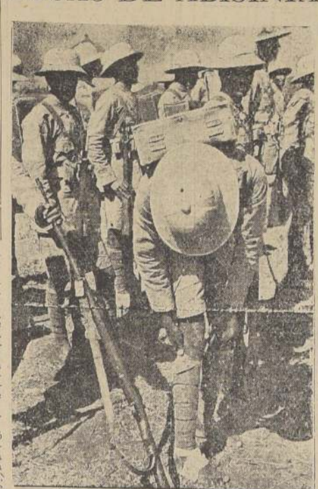
ITALIA DESARROLLA ARMAS QUIMICAS

PARA VOTOS BOTELLERÍA ZERBI MONJITAS 880 TEL. 62174