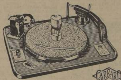
Modelo R.C. 80

El mejor y más completo cambiador automático de discos, para todas las velocidades. 78, 45 y 33 1/3 R. P. M., corriente alterna y continua de 110 y 220 volts. Apresúrese a reservar el suyo antes que se agoten.