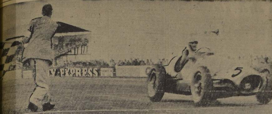
INFO DE ASCARI EN INGLATERRA.— El juez de llegada baja la bandera cuando el italiano Alberto Ascari cruza la meta conduciendo un auto Ferrari en la carrera "British Grand Prix" de Silverstone, en dos horas y 50 minutos, corriendo a 92,430 millas por hora. El segundo lugar lo obtuvo el argentino Juan Manuel Fangio, en Maserati; y tercero, el italiano Giuseppe Farina.