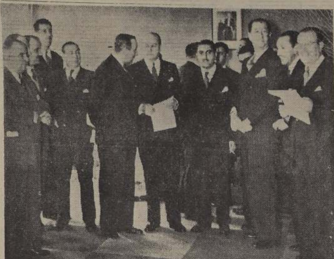
PROYECCIONES DEL PLAN DE DESARROLLO AGRICOLA CONOCIERON AYER PARLAMENTARIOS

PRECIO POR EL N.º 1086. NUESTRA UNICA DIRECCION