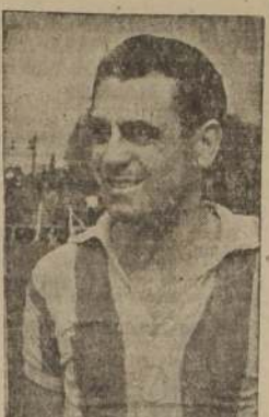
FANDISO.—No hace goles, pero sus compañeros saben aprovechar su juego de gran calidad