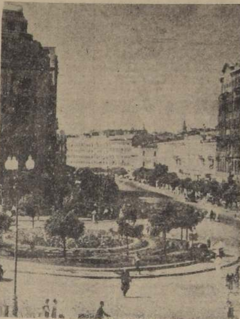
Una plaza en Kiev

EUROPA.—Bombarderos Moscovitas destruyeron a las fuerzas alemanas en la zona de la península de Kerc. Los aliados se apoderaron de Vasto y Venafro y cruzaron el río Garigliano.