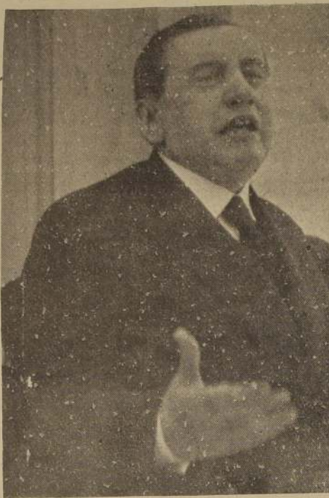
Sr. Arturo Alessandri Palma, senador electo por la Circunscripción de Curicó, Talca, Maule y Linares.