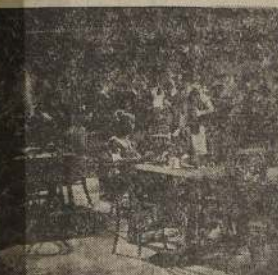
Charlie Chan hace sus investigaciones en un coctel.