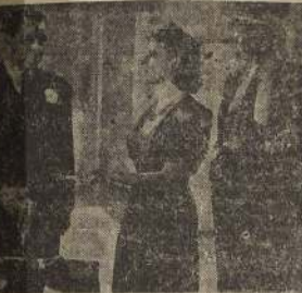
El vendedor de municiones puede estar complicado.