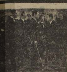
El jefe de policía sigue sus investigaciones.