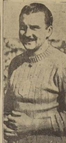
BUENOS AIRES, 4. — (U. P.). — El guardavallas chileno, Sergio Livingstone, conversó esta mañana, telefónicamente, del país vecino, con las autoridades del Racing Club, al que pertenece, ligado por contrato, para reiterar su negativa de regresar a Buenos Aires, y por ende prestar, nuevamente, su concurso a dicho equipo.

Habiendo llegado a esta situación, los directores del Racing han dispuesto reunirse mañana para considerar especialmente la oportunidad de desprenderse de Livingstone, bien mediante un pase definitivo contra reembolso, de buena parte de los 35,000 pesos que costó la transferencia del jugador, o ya sea por la cesión en préstamo mediante una prima menor.