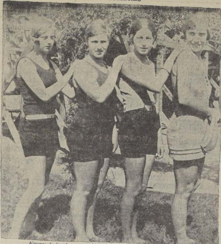
Algunas de las damas que intervienen en los 50 metros con handicap

LA REUNION ESTARA A CARGO DEL AUDAX CLUB DEPORTIVO ITALIANO. — SE CORRERAN LAS ELIMINATORIAS DE LOS CAMPEONATOS DE CHILE DE 100 METROS PARA DAMAS Y 500 METROS ESTILO LIBRE PARA HOMBRES