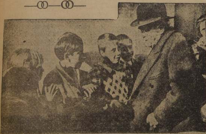
Albert Sarraut, Ministro francés del Interior, conversando con algunos de los niños españoles durante su viaje reciente a Le Perthus, en la frontera española.