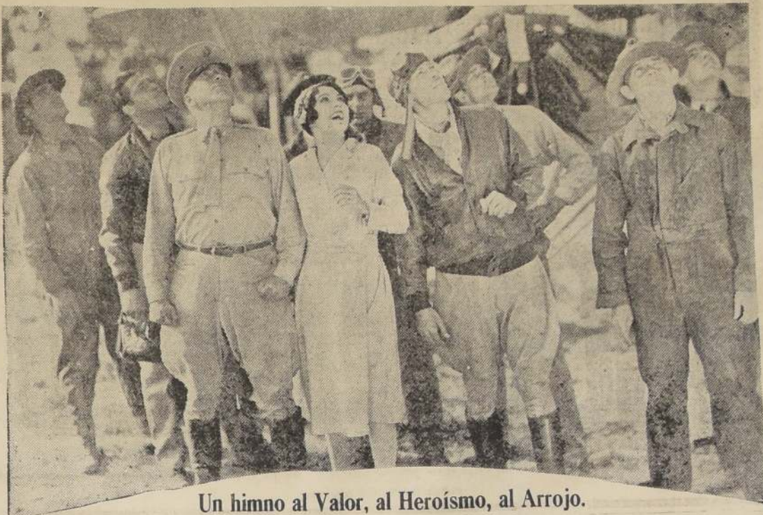
Un himno al Valor, al Heroísmo, al Arrojo.

Soberbia producción musical y sincronizada, en la que toda clase de ruidos se aunan a la acción para dar una impresionante sensación de realidad. En medio del bello y emocionante argumento, el zumbido de las hélices, el trepidar de los motores, el tronar de las ametralladoras y el estampido de las bombas, sobrecogen el espíritu ante un espectáculo dinámico e impresionante.