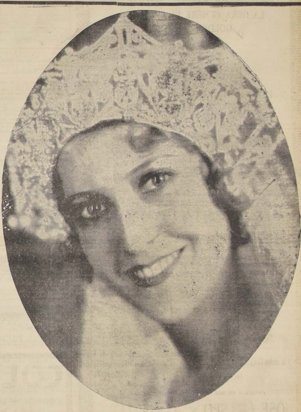
JEANETTE MAC DONALD

Es la renovadora del cinematógrafo, y está considerada en todo el mundo, por su belleza y sus dotes de cantante, como la primera figura de la pantalla en la hora presente.