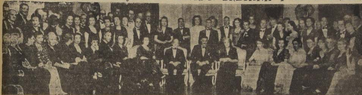
Asistentes a la brillante manifestación con que sus relaciones despidieron al Embajador de Gran Bretaña y Lady Orde, con motivo de su regreso a su país. Dicha manifestación consistió en un gran banquete en el Hotel Carrera