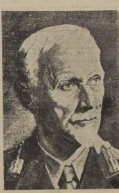
Mariscal Smuts, Primer Ministro de la Unión Sudafricana.

PRETORIA (Africa del Sur), 16.—(U. P.).— El Mariscal Smuts llegó a esta por vía aérea desde El Cairo; dijo que no se había fijado fecha para la ratificación por la Unión del acuerdo de las Naciones Unidas y que no se había tomado una determinación de si habrá una sesión especial del Parlamento con ese fin.