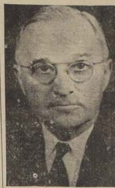
Harry S. Truman