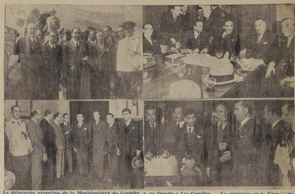
La delegación argentina de la Municipalidad de Córdoba, a su llegada a Los Cerrillos. — La recepción en la Casa Consistorial. — Durante la visita al Rector de la Universidad de Chile. — En los salones de LA NACION

—Efectivamente — contesta el doctor Latella —; pero estén ustedes tranquilos, porque si hubiesen venido todas las personas que deseaban formar parte de ella no habría sido suficiente