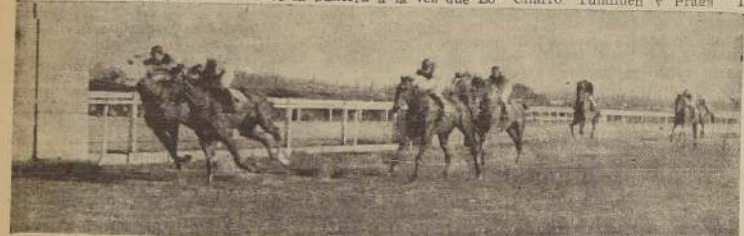
Profesa delante de Gargantilla, Santo Domingo y Cerberus en la séptima carrera del C. Hípico.