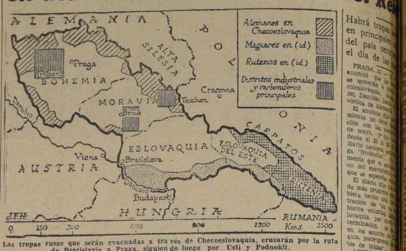
Las tropas rusas que serán evacuadas a través de Checoslovaquia, cruzarán por la ruta de Bratislava a Praga, siguiendo luego por Usti y Podnolki.