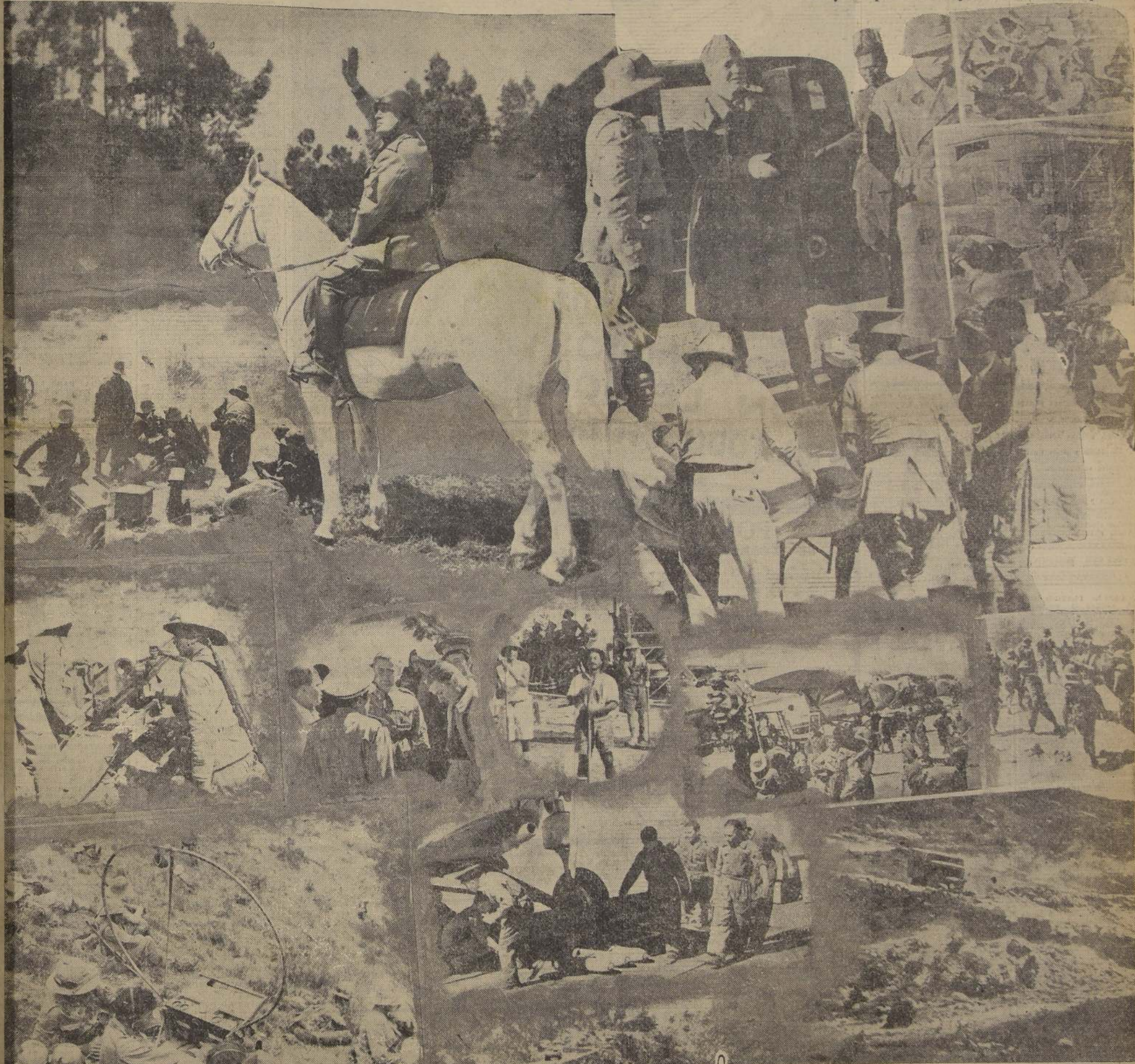
Composición fotográfica en la que pueden verse diversos aspectos de la campaña italiana en Etiopía, que ha terminado con la toma de Addis Abeba por las tropas del mariscal Badoglio, que entraron ayer, a las 16 horas, a la capital del Imperio del Negus.

Calma extraordinaria después de los días de terrible incertidumbre se ve ahora. — Soldados franceses y algunos etíopes ayudaron a patrullar la ciudad a los Sikhs. — Los merodeadores han desaparecido en general. — Sin embargo, la Legación de E. U. debió ser evacuada y después fué objeto de varios ataques más