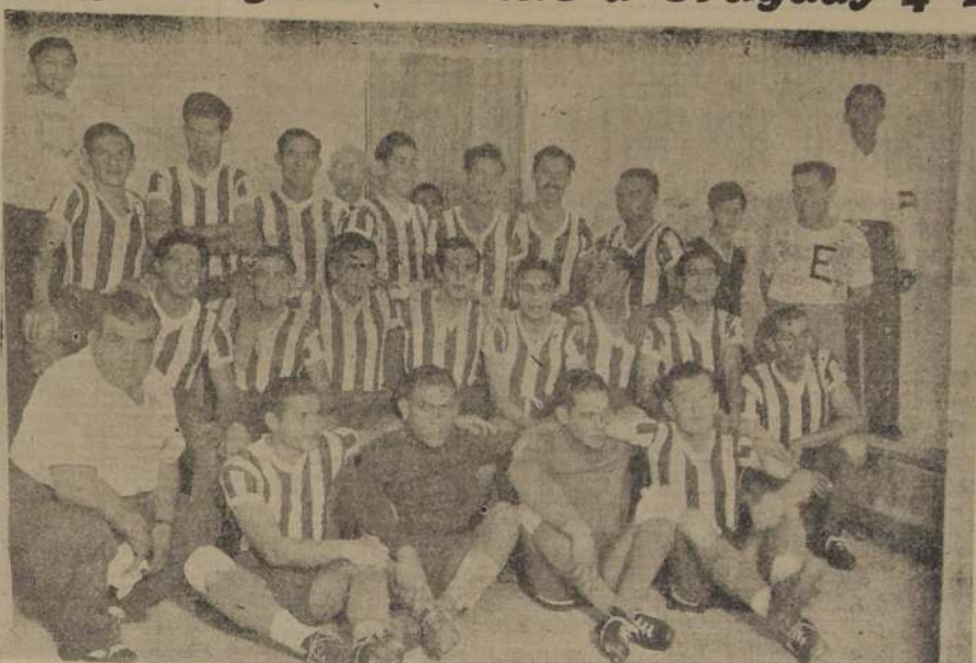
PARAGUAY. — La primera sorpresa del Campeonato Sudamericano, la proporcionó anoche el team paraguayo al doblegar a Uruguay por 4 a 2. Este resultado viene a favorecer directamente al equipo chileno.

GOAL DE GENES La nueva táctica que los pa-