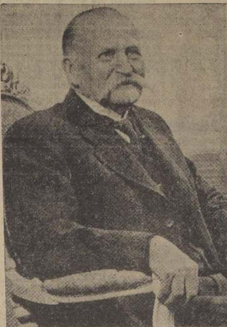
Presidente de la República de Finlandia, señor Kari Kallio, cuyo Gobierno ha contestado con toda energía las pretensiones rusas.