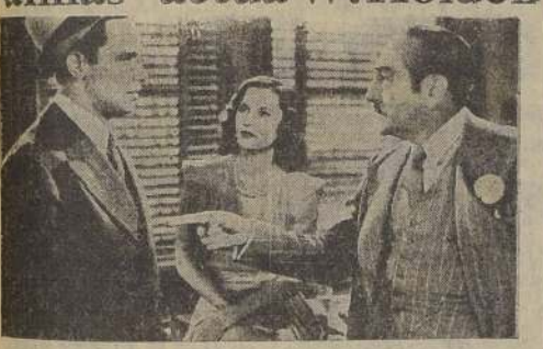
Dramática escena del film "El conflicto de dos almas", que es protagonizado por William Holden, sensacional descubrimiento de Columbia; Adolfo Menjou y Barbara Stanwick.