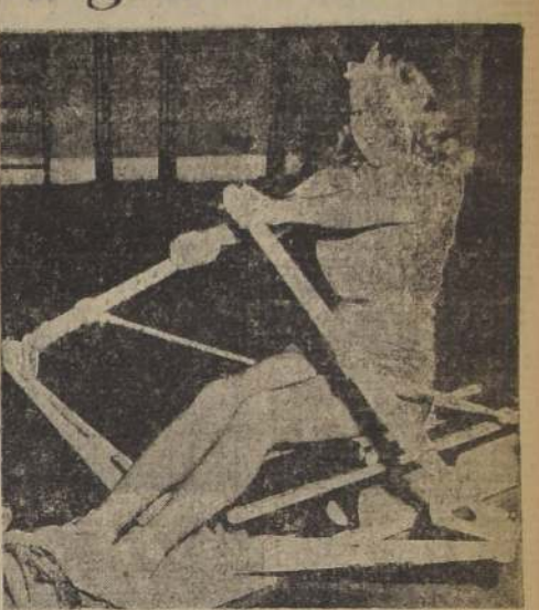
Lana Turner, tal vez la más esplendorosa estrella de la Metro Goldwyn, se divierte grandemente bogando en la piscina de ramal, a la vez que el ejercicio la ayuda a conservar su esculptural figura.