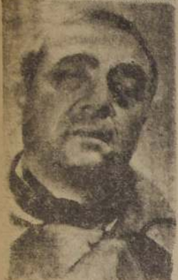
Raimu, el actor francés que protagoniza la película estrenada ayer en el Central.

Un éxito obtuvo ayer en las funciones del Teatro Central la producción francesa del año 1938 "Heroes del Marne", creación del actor Raimu.