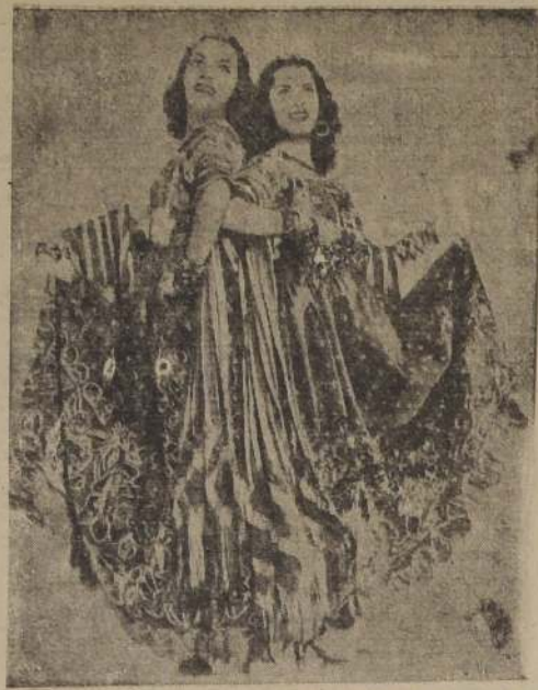
"Joyita y Maravilla", hermosas estrellas del teatro, cine y radio de México, que harán su debut en la noche del viernes próximo en el Tap Room Ritz. Estas jóvenes artistas han ganado prestigio en sus brillantes actuaciones de Estados Unidos y otros países, y son consideradas como talentosas intérpretes del folklore arteca. Después actuarán en el Casino de Villa del Mar.