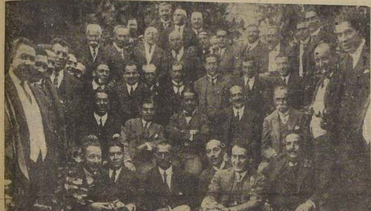
Parte de los asistentes a la manifestación ofrecida al Excmo. señor Aguirre Cerda el 28 de Noviembre de 1920.

HOY, COMO HACE 20 AÑOS, LA MISMA LINEA DOCTRINARIA ORIENTA LA ACTUACION DEL EXCMO. SEÑOR D. PEDRO AGUIRRE CERDA