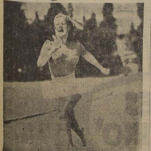
June Preisler, ex bailarina de Broadway, que ha sido contratada por la Metro, hace atletismo para perfeccionar la gracia de sus danzas y asombrarnos con la gracia de sus seductoras formas.