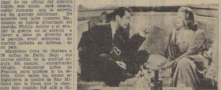
Rosalind Russell y Robert Montgomery, en una placentera escena de la película "La invitación peligrosa", liviana y bien tramada producción de la Metro.