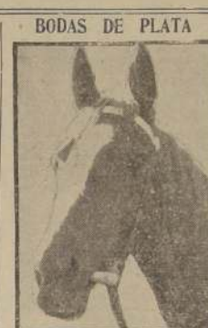
BODAS DE PLATA

Debutó ganando en el Club Hípico el día 11 de junio en un tiro de 1.300 metros, aventajando a Ludendorff, Monterrey, Bochinche y ocho más. Se clasificó cuarto detrás de Licencioso, Florello y Osorno, el 18 de junio. Remató penúltimo en el clásico "Alberto Vial Infante" ganado por el invitado Licencioso a Atropellador, Yambo, Letrado, Florello, Contrapunto, Adams y Mantul; remató segundo de Talismán el 13 de septiembre en los 1.800 metros del premio Nid d'Or, pero fue distanciado al tercer puesto por haber estorbado la libre acción de Yambo.