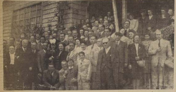
Asistentes al almuerzo ofrecido ayer por el Alcalde de V. del Mar y señora, en honor de los delegados al III Congreso de Cirugía Plástica y sus esposas

Guise con Aceite DOS "BANDERAS" Es un Producto "INDUS" LOS DELEGADOS AL TERCER CONGRESO DE CIRUGIA PLASTICA FUERON OBJETO DE ESPECIALES ATENCIONES EN V. DEL MAR INVITADOS POR EL ALCALDE VIALMARINO VISITARON LOS PARAJES MAS HERMOSOS DEL BALNEARIO Y SE IMPUSIERON DE LA OBRA CULTURAL Y ARTISTICA QUE CUMPLE LA MUNICIPALIDAD A TRAVES DEL DEPARTAMENTO DE BELLAS ARTES ESPECIALES RELIEVES ADQUIRIO EL ALMUERZO EN GRANADILLAS