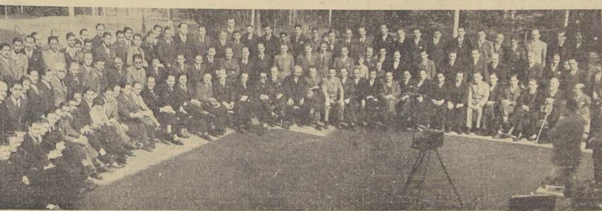
Personal de la Caja de Empleados Públicos y Periodistas que asistió al almuerzo de ayer

Por haber llegado tarde, no alcanzó a darse cuenta ayer mismo en el Senado de este mensaje, lo que se hará en la sesión ordinaria de esta tarde.