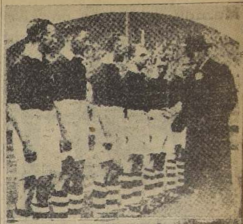
S. M. el Rey Jorge V saludando al equipo de Manchester antes de iniciarse la gran contienda

Se salvó una serie de peligrosas embestidas, que cuando el árbitro tocó el pitazo final, cayó desmayado en su propio arco.