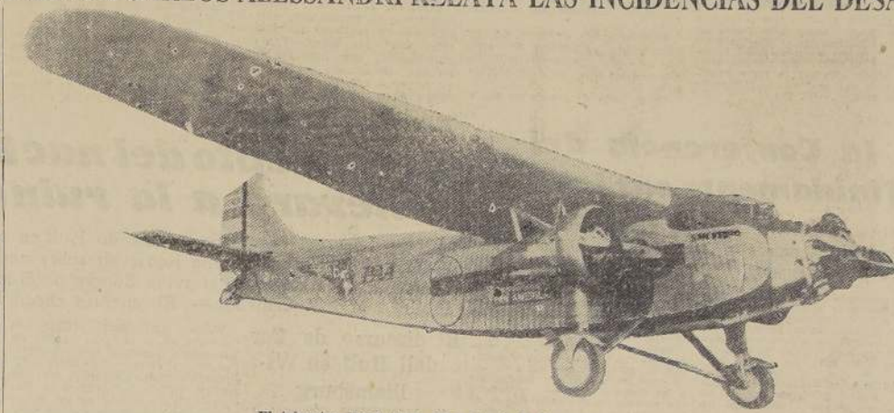
El trimotor Ford "San Pedro", de la Panagra

El trimotor salió del puerto aéreo de Morón,