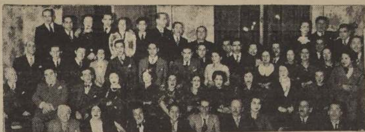
Asistentes al te-dansant con que el Sindicato de Empleados de Farmacias e Industrias Farmacéuticas celebró el 4.º aniversario de su fundación. Esta reunión social se llevó a efecto el domingo próximo pasado, en el local de la Unión Comercial.