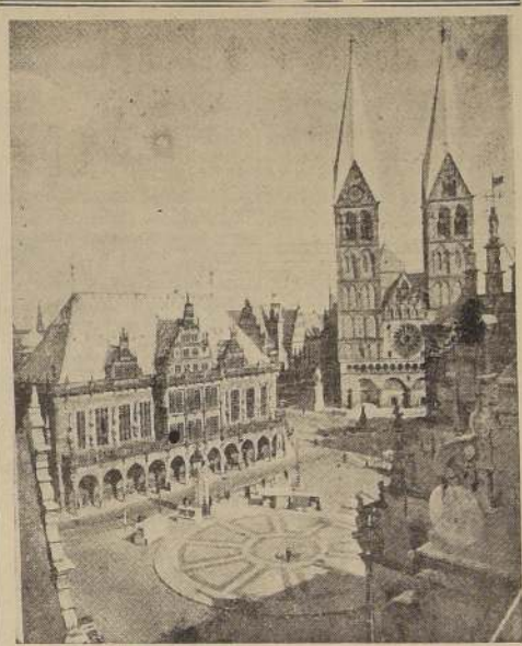
La plaza principal de Bremen con la Catedral y el Ayuntamiento

Un grupo de tanques británicos se lanzó contra una cortina de carros blindados enemigos que apareció frente a los campos minados de Charing Cross, sobre una escarpada, a 8 kilómetros de Marsa Matruh. El enemigo se replegó entonces sobre la columna principal de la costa, que está movilizándose lentamente.