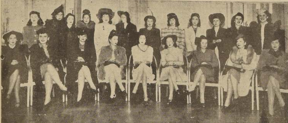
Despedida de soltera a la señorita Novoa Monrea, con motivo de su próximo matrimonio, la que se realizó en los salones del Crillon

DEL CENTRO ARGENTINO. El Centro Argentino ha organizado una comida que se efectuará en el Roof-Garden del Carrera, el día 9 de julio, con el fin de celebrar la festividad de esa fecha.