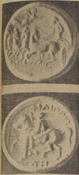
La medalla más antigua que nos es conocida, que representa un carro de carrera. Tetradrachma del siglo V, antes de J. C. El jinete, en su presentación más corriente. Medalla de plata del Rey Filipo, de Cacedonia, y del siglo IV antes de la era cristiana.

pesados sacrificios de tiempo y del dinero, era cosa perfectamente entendida para un griego libre, que, desde los siete años para adelante, fuera considerado su cuerpo como cosa racional y educado y preparado hasta su máxima perfección y entrenamiento. Para ese efecto, el Estado les proporcionaba palmas y gimnasios. No eran canchas de deporte tal como ahora las entendemos, sino, por decirlo así, librerías escuelas superiores para la formación y cultivo de la "Kalo-kagalia"—aquella especialidad técnica de vida que conducía al culto al equilibrio físico-físico, mediante el desarrollo de todas las fuerzas humanas. Esto explica el secreto de las increíbles hazañas en todas las actividades culturales de este pueblo extraordinario, aunque tan poco numeroso.