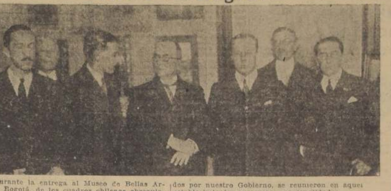
Durante la entrega al Museo de Bellas Artes de Bogotá, de los cuadros chilenos obsequiados por nuestro Gobierno, se reunieron en aquel establecimiento numerosas personalidades.