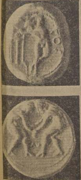
Un estatera que representa a un luchador de Aspendos, en Pampilia (Siglo III)

ron la atención sobre la carga que significaban esos atletas profesionales, cuyo excesivo costo y grosería tenía que pagar la nación con sus tributos. Las consecuencias no se dejaron esperar, y el día llegó en que los últimos restos de la antigua nobleza olímpica (Griega, se hundieron en el cieno de la baja profesión de gladiadores romanos.