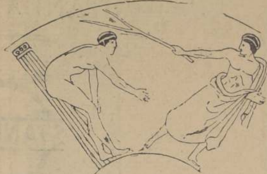
Hace dos mil quinientos años. — El director del combate, da la orden de partida con su vara.

Nada menos que el gran Sócrates, junto con otros filósofos y poetas, pasó la mayor parte de su vida debajo de los cubiertos recién.