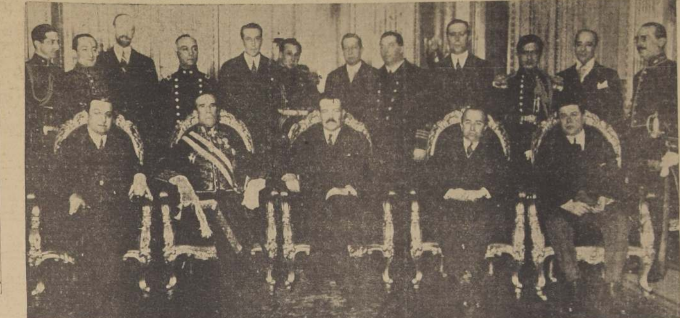
S. E. el Presidente de la R. U. S. A., en virtud del Tratado comercial del nuevo Empire argentino. Excmo. señores Quintana

S. E. EL PRESIDENTE DE LA REPUBLICA LO RECIBIO AYER, A LAS 15 HORAS, EN EL PALACIO DE GOBIERNO