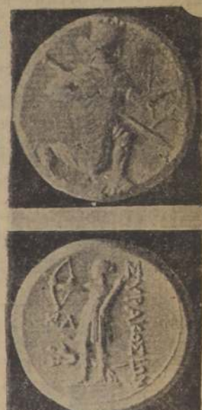
Presentación de una carrera de rodillas, grabada en un tetradrachma persa con la efigie del sátrapa Memnon de Carie.

Para la vigorización general del cuerpo hacían frecuentes ejercicios en el salto, en el lanzamiento del disco y de la bala y en la garrocha. Los luchadores y pugilistas se ejercitaban, fuera de sus prácticas en el saco de arena, en el punching ball y en pesados trabajos agrícolas, como arar y hacer zanjas. Más, a ningún objetivo del entrenamiento, se daba mayor cuidado que a la dieta. En la edad de oro del atletismo griego, hasta el cuarto siglo antes de Jesucristo, se alimentaban de la manera más sencilla, con pan de cebada, de afrecho, de trigo sin levadura, y más tarde con carne de buey, de cabro y de cerdo. A los comienzos de la decadencia, y a causa del cundimiento de la profesión de atleta, hicieron su aparición nuevas costumbres y experimentos en la dieta, tendiendo todos fundamentalmente al mayor consumo de substancias secas. Vegetarianos puros, que solamente disfrutaban