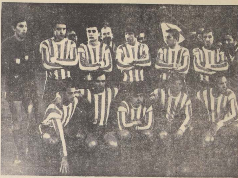
RACING CLUB, DE BUENOS AIRES.—El campeón del mundo de clubes llegó ayer dispuesto a debutar esta noche ante Colo Colo, trayendo lo mejor que tiene en su plantel, aumentando su potencial con valiosas adquisiciones.

Racing, con muchas nuevas adquisiciones de real calidad, manteniendo a los "mundiales" Perfumo, Díaz, Rallo y otros valores que nuestro aficionado ha tenido la oportunidad de apreciar, será atracción indiscutible y aportará su jerarquía internacional a la reunión doble del Estadio Nacional.