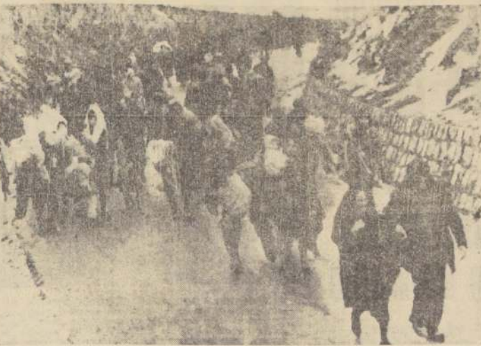
GIBELINA, Sicilia — Las víctimas del terremoto bajan por los caminos de la montaña portando enseres y niños, después de los violentos temblores que causaron pánico y destrucción en esta isla. Las autoridades temen que el número de muertos sea bastante alto. Este ha sido el terremoto más violento que se ha sentido en Sicilia desde 1908, cuando 75 mil personas murieron.