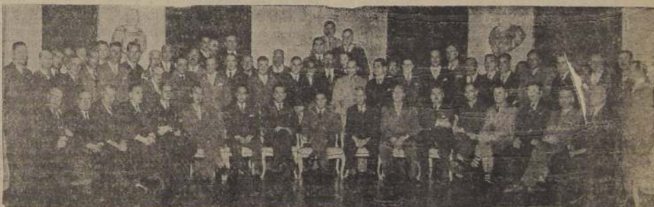
Asistentes a la manifestación ofrecida por el gremio cinematográfico, en honor del actor mexicano Mario Moreno (Cantinflas), que reunió a todos los empresarios de teatros de nuestra capital