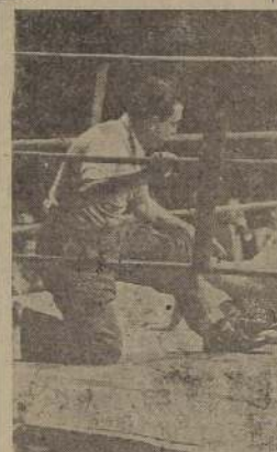
Ya hemos dicho que el catch en los Estados Unidos es un deporte obligatorio como el box, la natación y la gimnasia, entre todos los hombres que militan en las armas navales terrestres y aéreas.

El público sigue de pie las diversas incidencias de las diversas luchas que resultan en peleas dramáticas y sangrientas y otras cómicas, divertidas pero de un gran realismo y emoción deportiva.