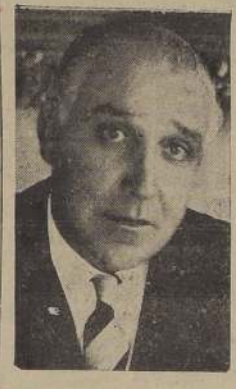
Ministro de Defensa Nacional, señor Alfredo Duhalde Vázquez