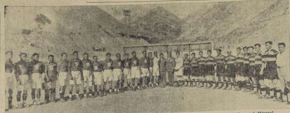
El seleccionado de Sewell con el cuadro del Badminton que sostuvieron el domingo un interesante match en el Mineral.

Un meritorio triunfo fue el que obtuvo anteayer en Sewell.