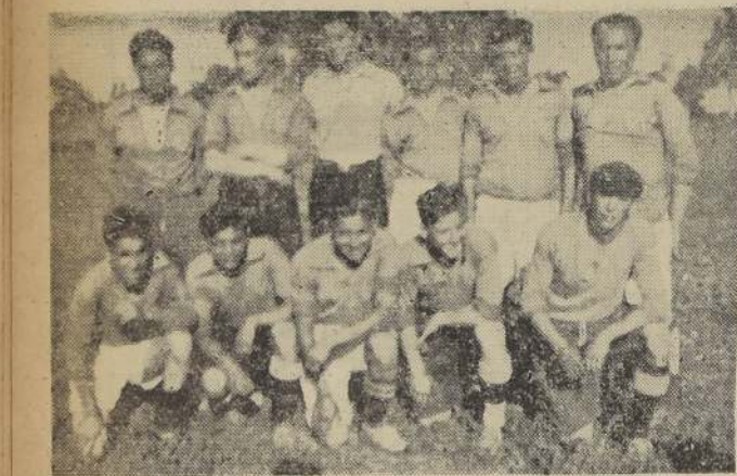
Primer equipo del Wellington F. C.