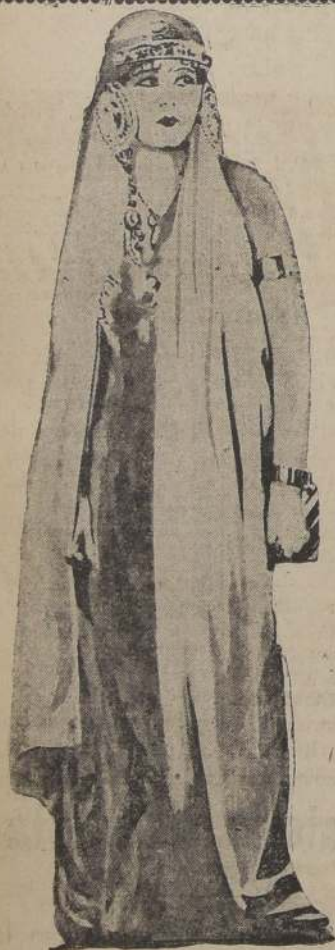
APTA PARA MENORES

Mañana EN EL TEATRO Alhambra — Y EL — SABADO 6 — EN EL — Imperial