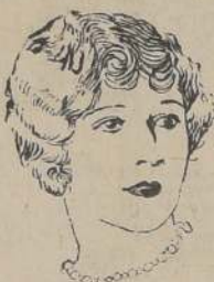
ANNA Q. NILSSON