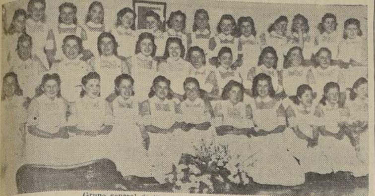
Grupo general de las alumnas de la Escuela de Enfermeras