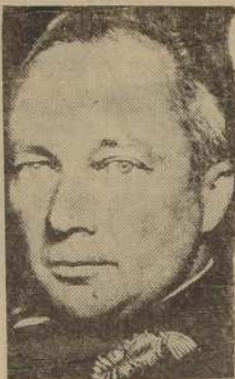
Mariscal von Kluge "El Führer, en carta cordial, ha expresado en corales términos..."

"Orden del Día emitida en el Cuartel General del Führer: En lugar del General Mariscal de Campo von Rundstedt quien se encuentra impedido por el estado de su salud, el General Mariscal de Campo von Kluge ha asumido el Comando Supremo en el oeste.