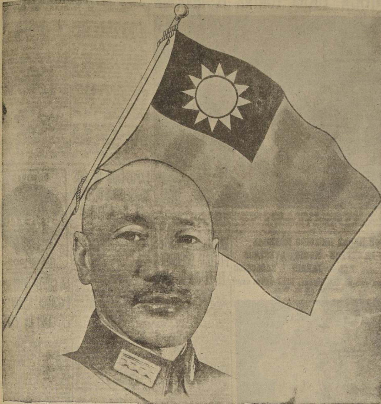
Presidente Chiang Kai Shek