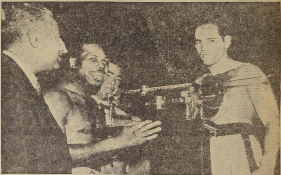
PESAJE. — El campeón mediano peso Archie Moore, a la izquierda, sonríe confiado mientras su rival, Carl (Bobo) Olson, confirma su peso para el encuentro que sostendrán anoche. Olson, campeón mundial de peso medio, registró 77.223 kilos, y Moore, 79.378.