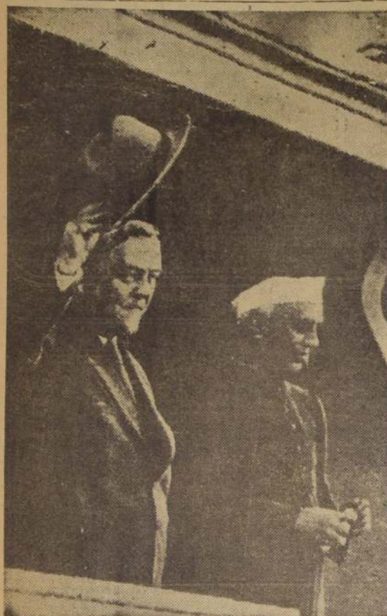
MOSCÚ. — El Primer ministro soviético, Nikolai Bulganin (izquierda) y el Primer Ministro de la India, Jawaharlal Nehru, agradeciendo las aclamaciones de la muchedumbre moscovita durante una visita al Estadio Dnyamo. Se ha anunciado que Nehru invitó a Bulganin a visitar Nueva Delhi.