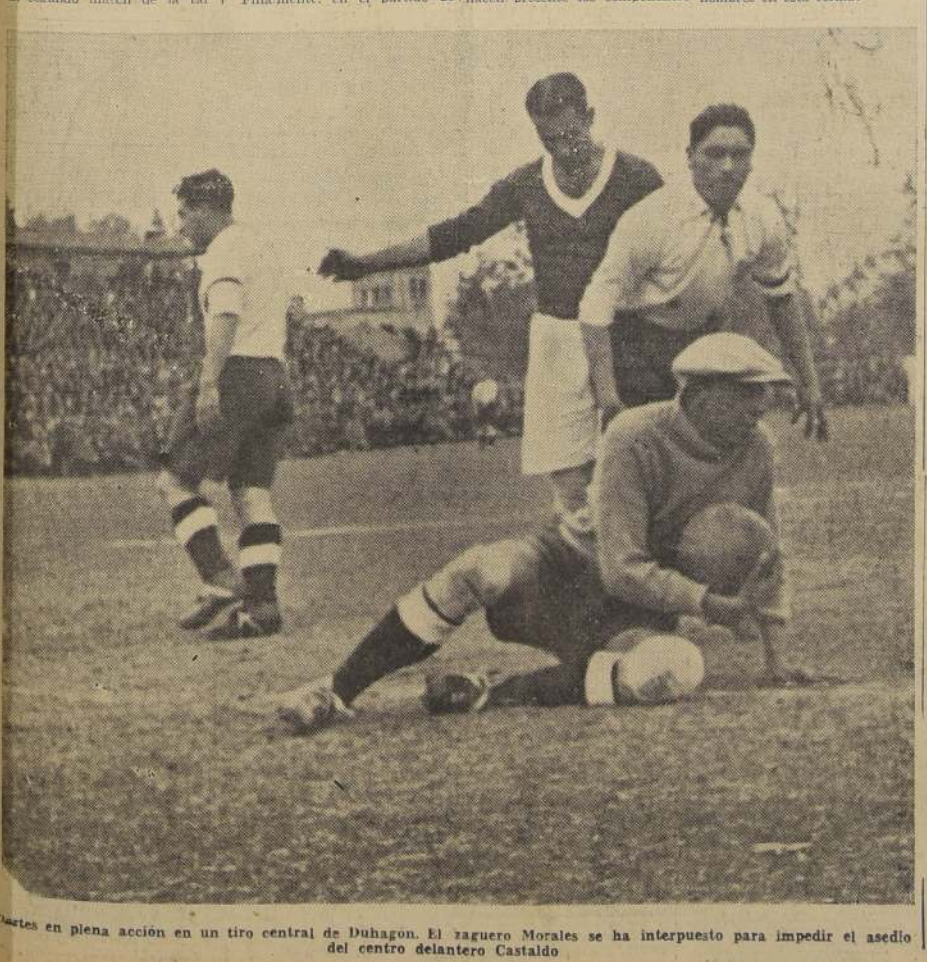
Juantes en plena acción en un tiro central de Duhagón. El zaguero Morales se ha interpuesto para impedir el asedio del centro delantero Castaldo

PARA VINOS Y LICORES BOTELLERIA ZERBI MONJITAS 880 TEL. 62174