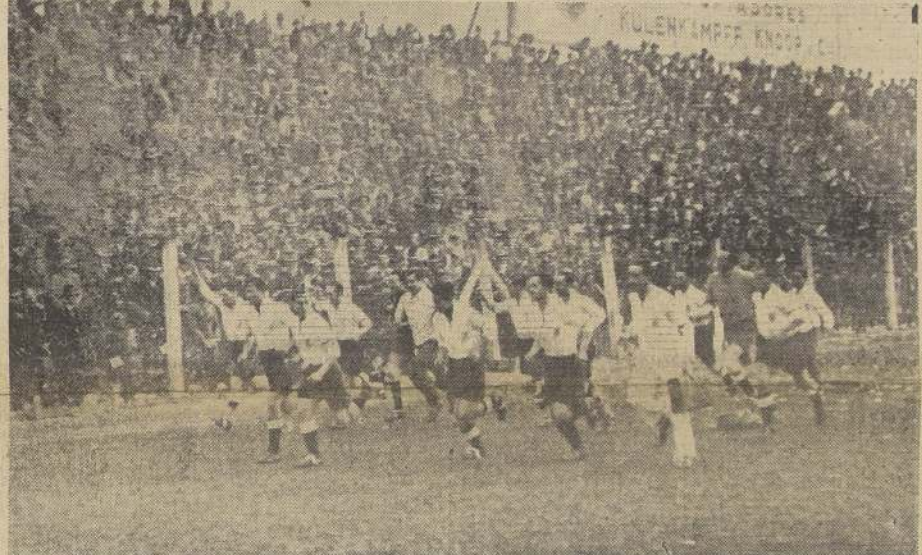
El elenco albo durante su paseo triunfal por las tribunas populares