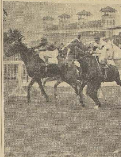
Llegada del clásico "Luis Cousino". Ripley, derrotó en forma aplastante a Toffee, Helesponto, Sirenia y Morea.