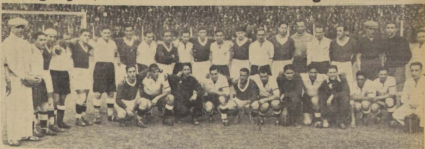
Los equipos del Colo Colo y del Defensor de Montevideo posan para "La Nación", momentos antes de iniciarse la gran jornada de ayer