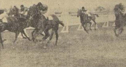
Ripley, el notable Campanazo, que confirmó al ganar al galope el clásico "Luis Cousino".