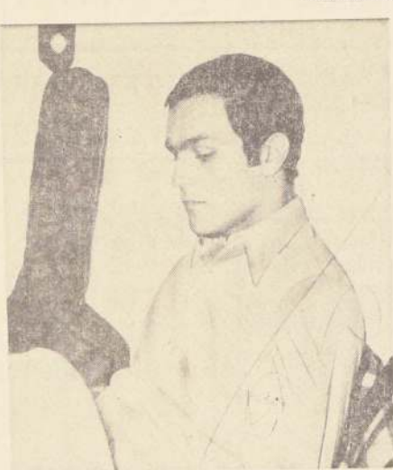
Leonardo Favio, en un momento de reposo

Favio ha llegado a imponerse desde "Fuié mia en verano" en forma sorpresiva, incluso para él mismo.