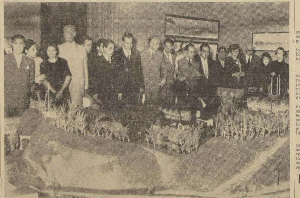
Aistentes a la inauguración de la Exposición de Arte Popular realizada ayer en el Palacio de Bellas Artes