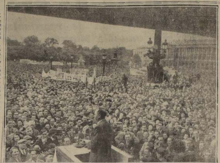
PARIS.—La celebración del 14 de Mayo en París.—Una multitud que se calculó en 60 000 personas, se reunió en la Plaza de la Concordia, para escuchar a Maurice Thorez, en primer término, secretario general del Partido Comunista, quien pronunció un enérgico discurso.

Por 27 votos contra 10, la Asamblea General de la Organización Internacional de Aviación Civil (OACI) eliminó a España de su lista de miembros. La resolución fue adoptada por unanimidad en la sesión plenaria que se celebró en Ginebra el 12 de mayo.