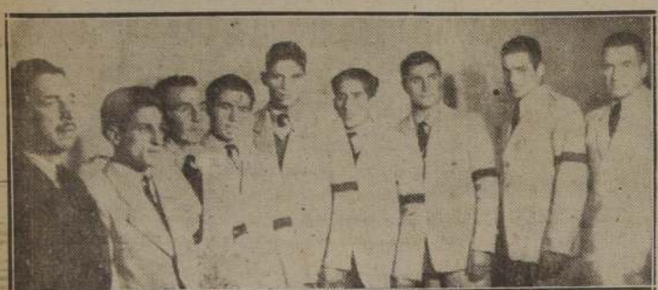
Equipo de la delegación de Talca