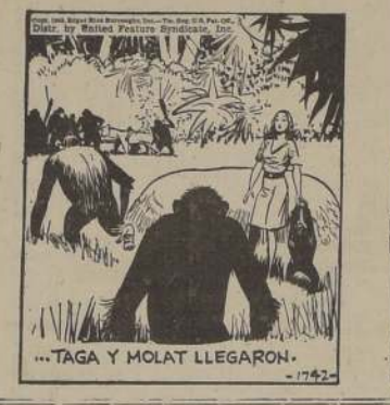
...TAGA Y MOLAT LLEGARON.