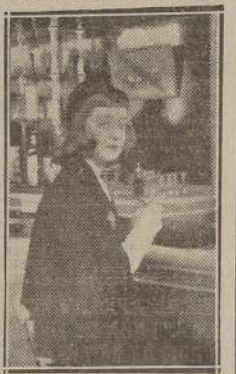
Para mañana se anuncia en la pantalla del Teatro Rex el estreno del drama "Vida Robada" que tiene en Bette Davis su principal intérprete. Se anuncia en esta película, entre otros, a Glenn Ford, Dana Clark, Walter Brennan y Charlie Ruggles.

Dicen algunos críticos que Bette Davis, en los dos papeles que interpreta en la cinta mencionada, simboliza la doble personalidad de la mujer... ¿qué opinan ustedes?