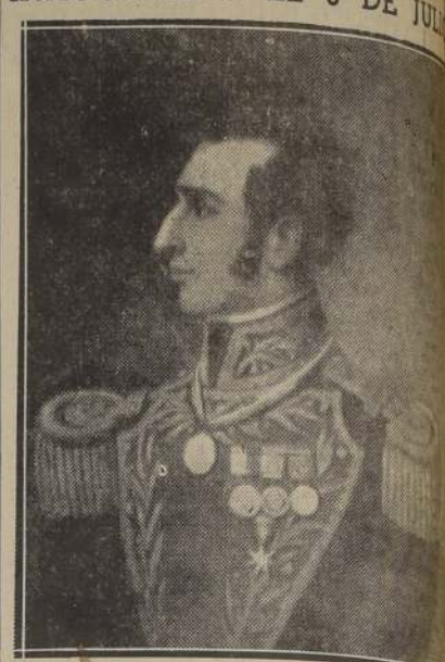
Un busto de bronce sobre un pedestal de cuatro metros de altura será erigido en la plaza ubicada en la Avenida Sucre con Avenida Antonio Varas, en memoria del héroe de Ayacucho, y uno de los más grandes libertadores de América, don Antonio José de Sucre. Este monumento se levantará bajo el patrocinio de la Municipalidad de Valparaíso, con la ayuda económica de la población de la comuna, y el 5 de julio. La "maqueta" del Colón ha sido terminada y exhibida en el Palacio Municipal de Rufo.

El Cardenal J. M. Caro ordenó oraciones para que termine pronto la sequía.