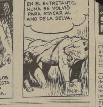
EN EL ENTRETANTO, HUMA SE VOLVIÓ PARA ATACAR AL AMO DE LA SELVA.