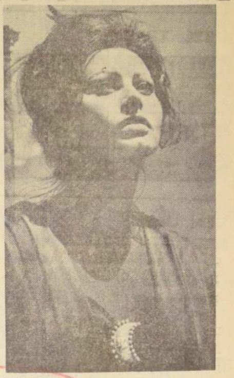
SOFIA LOREN, Dijo: "Los hijos son un milagro. Para mí este milagro no se ha verificado todavía".

Asista Ud. también a despedirlos en la CARPA MODERNA: ALAMEDA 1461 — Miles y miles de niños asisten a verlos por última vez: